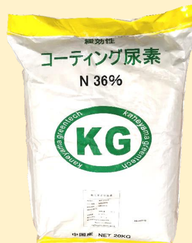
コーティング尿素